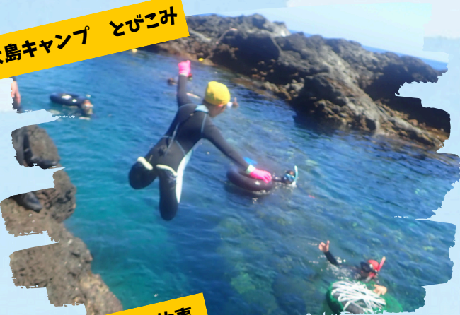
大島キャンプ とびこみ