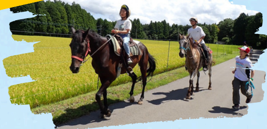
乗馬キャンプ 馬との生活