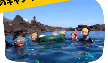
ウエットスーツの貸し出し有り