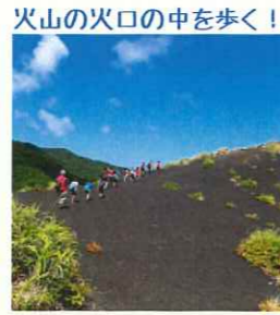
火山の火口の中を歩く！

7月31日(木)夜~8月3日(日) 船中1泊 民宿2泊 小学2年生~中学3年生 ワンパク大学が生まれた島です。何度も噴火を繰返しながらも蘇りまさに生きている島です。