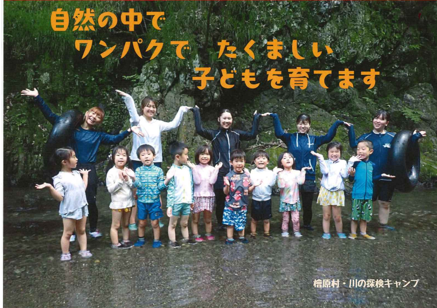
檜原村・川の探検キャンプ