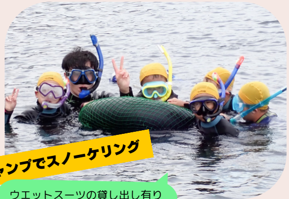
島のキャンプでスノーケリング