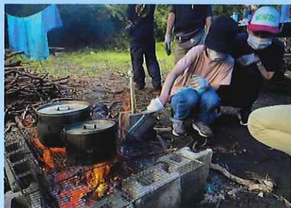
電気ガスもない森でテント生活