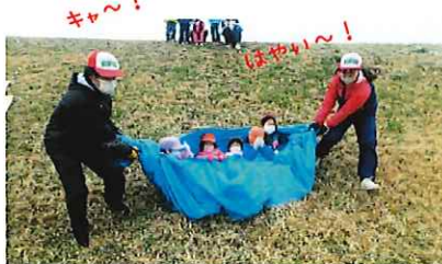
大人気！ ブルーシートすべり！

毎年恒例、土手すべり、たこあげ。小学生は、「むかしあそび」も楽しみました。 寒くても体を動かして遊べば、からだもぼかぼか