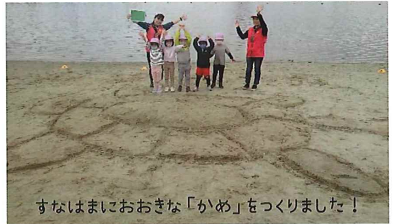
すなはまにおおきな「かめ」をつくりました！

ひろいすなはまでたっぷりのすなをつかってあそぼう！みんなでちからをあわせて、おおきなすなのさくひんをつくろう。