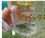
バッタとコオロギ

集合 8時30分 / 解散 16時30分 場所 八国山緑地 交通 西武新宿線 対象 定員 幼児 15名 参加費 幼児 8,500円