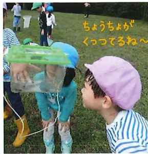
ちょうちょうが くっつてるね～

バッタやコオロギを見つけよう！チョウチョやトンボもさがそう！むしとなかよくなって、じっくりみたあとは、むしたちのおうちにかえしてあげよう！