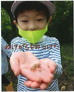
めけがらをみつけた