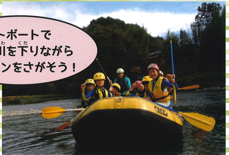
※ウエットスーツなどの装備は貸出します。

さんらん かわ さけ み 産卵のために 50キロも川をさかのぼってくるサーモン(鮭)を見つけよう！