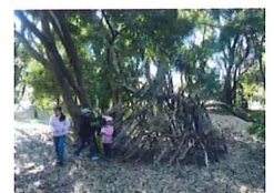
大きな秘密基地ができた！