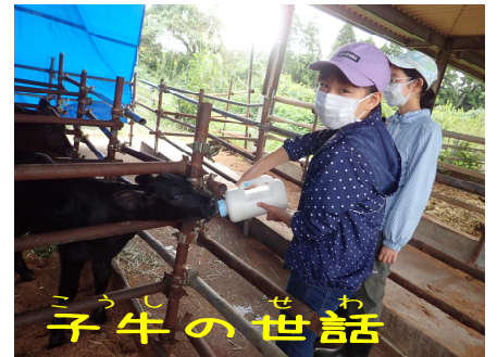
こぶし 牛のお世話