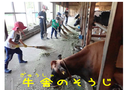
ごうしや 牛舎のそうじ

いつも飲んでいる牛乳。何も気にせずに当たり前前に飲んでいませんか？ 牛はどんなところで育てられているのか、何を食べているのか？ 牛を育てる仕事とはどんなことをするのか？ 牛小屋のとなりにテントを張って、牛と一緒に生活をします。乳しぼり えさやり バターづくりなどを体験し、 日常ではできない「動物とのふれあい」「命」「食」について考えていくキャンプです。